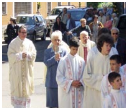
La Responsabile generale, lasciato l'oratorio, sta per portare le reliquie nella chiesa parrocchiale.