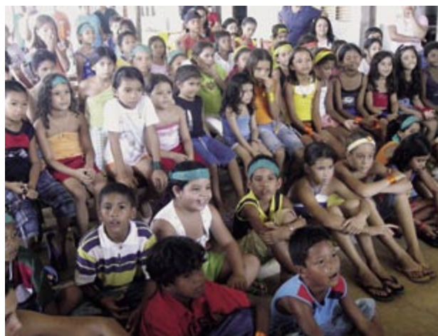
I bambini del “Centro de saude pédiatrico P. Luiz Monza”.

un misto di rabbia e di tristezza si agitava dentro di noi. Ma procedendo nella nostra avventura, visitando altri posti come la periferia della capitale, Macapà, o l’Elisbao (un quartiere costruito interamente sull’acqua contaminata da cui gli abitanti non se ne vogliono andare), o facendo una gita sul Rio, sulle cui sponde abitano molte persone che vivono raccogliendo la frutta e pescando, abbiamo capito un po’ di più la loro cultura, ancora così legata alla natura e ai suoi ritmi che poco ha a che fare con il nostro modo di vivere. Il lavoro che viene fatto al “Centro de saude pédiatrico P. Luiz Monza” ci ha colpito e ci è piaciuto moltissimo proprio per