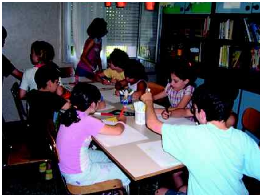
Attività extrascolastica di espressione grafo-pittorica a La Nostra Famiglia di Treviso.

Il principio della personalizzazione ha come scopo ultimo la garanzia del successo scolastico e formativo di ciascun alunno e quindi la riduzione della dispersione scolastica, molto elevata in particolare nella scuola superiore di secondo grado. La personalizzazione dei percorsi scolastici e formativi è un principio che ha una lunga storia nel nostro sistema scolastico: la ricerca pedagogica italiana del secolo scorso ha sviluppato molte riflessioni e sperimentazioni in tal senso per elaborare strategie capaci di adattare la proposta di formazione alle caratteristiche per-