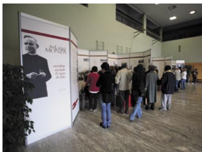
La mostra fotografica su Don Luigi Monza.

Associazione La Nostra Famiglia – Via don Luigi Monza 1 – 22037 Ponte Lambro (Co) – Tel. 031 625111 Fax 031625267