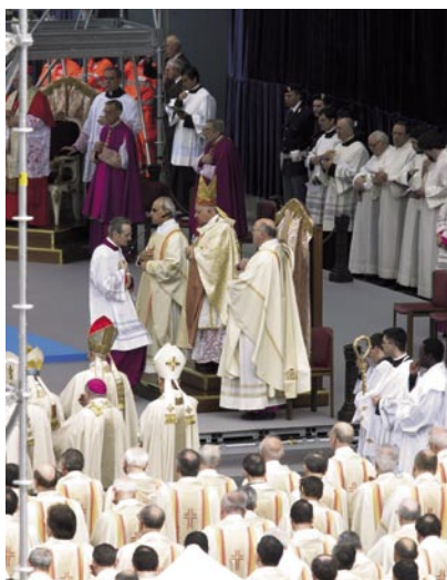
30 aprile 2006, Milano. Un momento della celebrazione che ha visto la presenza di 200 sacerdoti e 15 vescovi.

Tale solenne concelebrazione ha visto la partecipazione di quindici vescovi, duecento sacerdoti, varie autorità civili e militari, e dodicimila fedeli provenienti dalle parrocchie ambrosiane, dalle diverse sedi de La Nostra Famiglia e dai Paesi in via di sviluppo (Brasile, Ecuador, Sudan) dove essa è presente. Circa 2200 sono stati i collegamenti di chi ha seguito la celebrazione in diretta su Internet