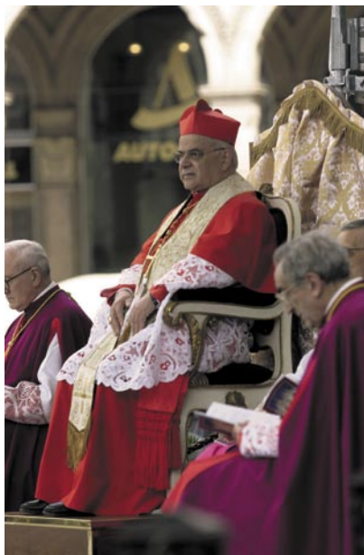
30 aprile 2006, Milano. Il legato Pontificio cardinale José Saraiva Martins

Ed è suggestivo riflettere che la più antica statua del Duomo sembra essere quella di san Pietro. È l'indice