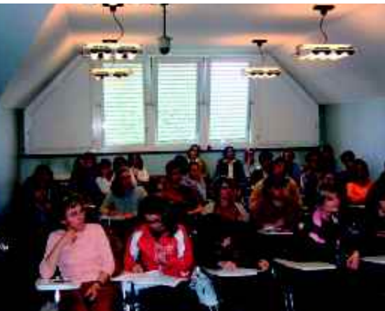
Partecipanti al Corso per insegnanti "Il bambino autistico a scuola" a La Nostra Famiglia di Bosisio Parini.

I l Settore Formazione Continua, che aveva già provveduto negli scorsi anni a registrare l'Associazione La Nostra Famiglia e l'IRCCS "E. Medea" presso il Ministero della Salute come provider per l' Educazione Continua in Medicina (ECM), è ora alle prese con l'accreditamento dell'IRCCS "E. Medea" a livello regionale. Si tratta di una pratica molto laboriosa, che è finalizzata a consentire il riconoscimento di tutti i Corsi e i Convegni che normalmente vengono riportati in questa rubrica, affinché possano far conseguire agli operatori che li frequentano l'acquisizione di crediti formativi ECM, re-