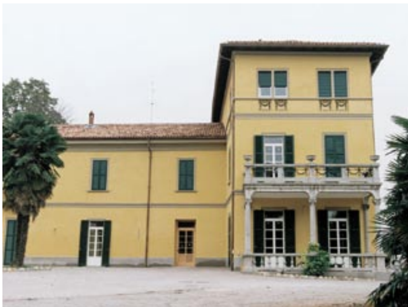
La sede della Comunità Giorgio Boriolo a Villa Luisa di Besana Brianza (MI).

Seguendo questi criteri, la Fondazione ha realizzato, o sta completando, alcune soluzioni abitative. Il primo progetto portato a termine è la Comunità “Giorgio Boriolo”, che ha sede a Villa Luisa di Besana Brianza. L’iter di questo progetto è una chiara dimostrazione di come gli avvenimenti si compiano meglio quando molte volontà tendono ad un unico scopo. In realtà la FONOS dimostra proprio, al di là degli schemi giuridici o teorici, quanto sia importante unire la volontà di più persone per arrivare ad