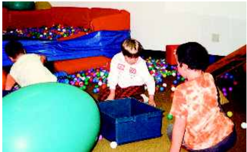
Nelle foto: momenti di vita alla Scuola de La Nostra Famiglia di Conegliano

Un “team leader”, che ha visitato il Circolo di Conegliano per il processo di valutazione il 2 febbraio, nel colloquio intercorso tra team e staff di direzione, ha posto una nota di merito in particolare sulla gestione della leadership; sul-