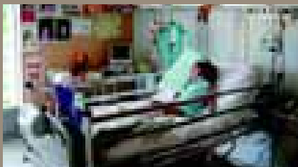
LE PAROLE PER DIRLO