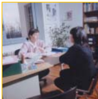
Colloquio con genitori