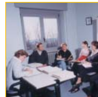
Incontro di équipe

Alla dimissione viene formulato un indirizzo per orientare le successive fasi di crescita del minore.