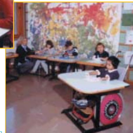
Attività scolastica di piccolo gruppo