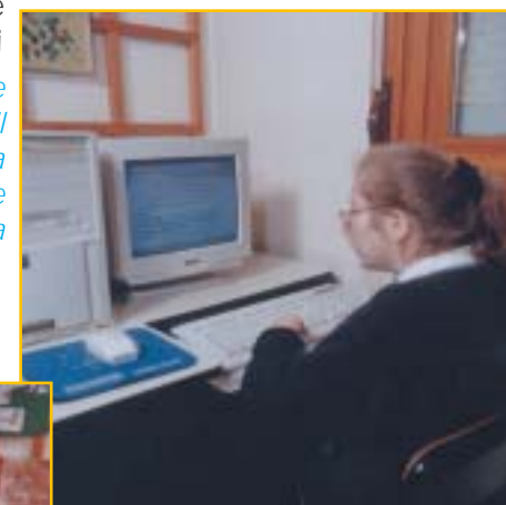
Attività scolastica con ausili informatici

Per i bambini accolti in day-hospital e a tempo pieno, funzionano presso il Centro una Scuola Materna privata e una Scuola Elementare Statale convenzionata con il Ministero della Pubblica Istruzione.