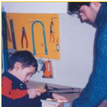
Terapia occupazionale pratico-manuale