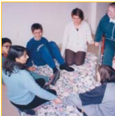
Intervento di sostegno psicoterapico di gruppo