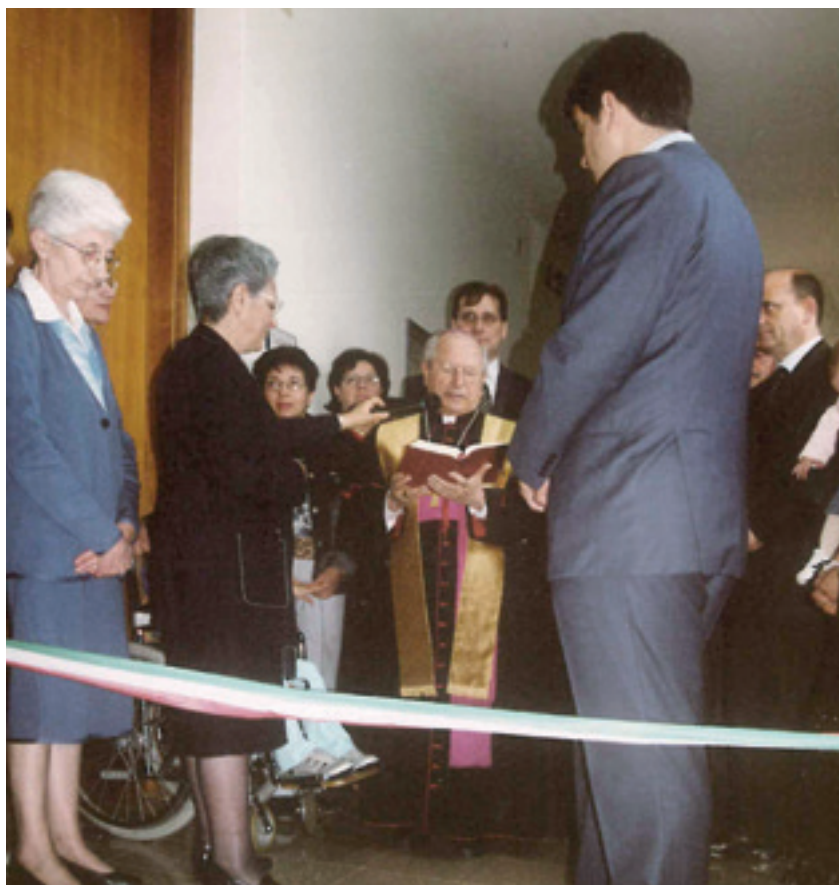
Ostuni, 1 marzo 2004: inaugurazione del Polo pugliese dell'IRCCS Medea

L'epilessia nelle malattie genetiche e nelle cerebrolesioni è stato in questi anni un ambito di importante di intervento sia clinico che di ricerca, mediante monitoraggi a lungo termine con video-EEG, studi genetici attraverso tecniche di sequenziamento di nuova generazione mirato (NGS), utilizzando pannelli specifici oppure tramite sequenziamento dell'esoma e follow-up prolungati. L'impegno nel campo delle terapie delle epilessie farmacoresistenti pediatriche vede il Medea di Brindisi impegnato anche verso