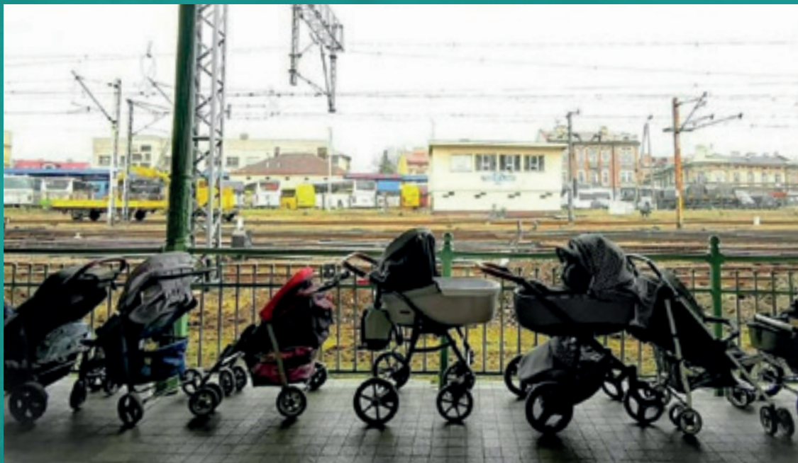
Un piccolo gesto di resistenza umana: le mamme polacche lasciano i loro passeggini per le famiglie ucraine che fuggono dalla guerra.