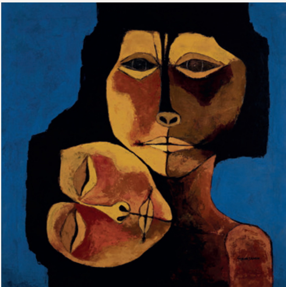
Oswaldo Guayasamin, Madre y niño , 1992

“Pensare alla morte è pensare a rendere la vita più solenne, è rendere la vita più felice, è afferrarsi alla vita con il desiderio di essere eterno per sempre” (Erico Puente Colorado).