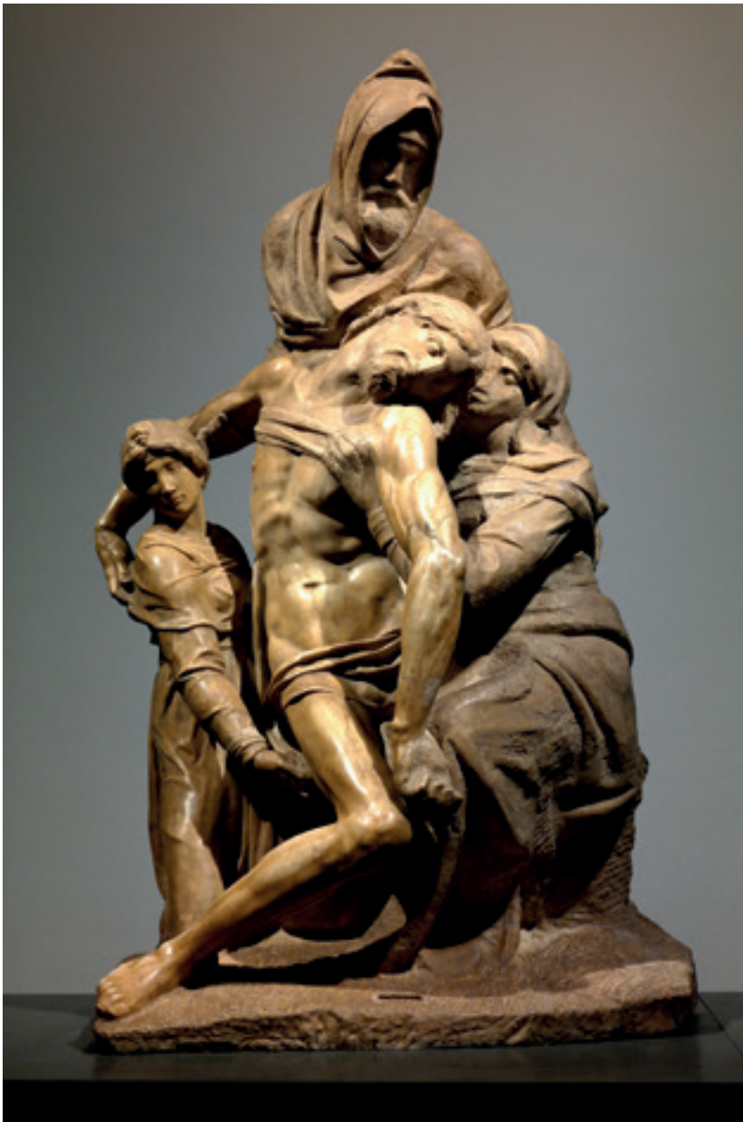
Michelangelo Buonarroti Pietà Bandini, 1547-1555 circa Museo dell'Opera del Duomo a Firenze