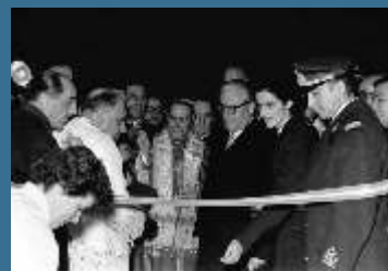
La sede di Ostuni compie 60 anni