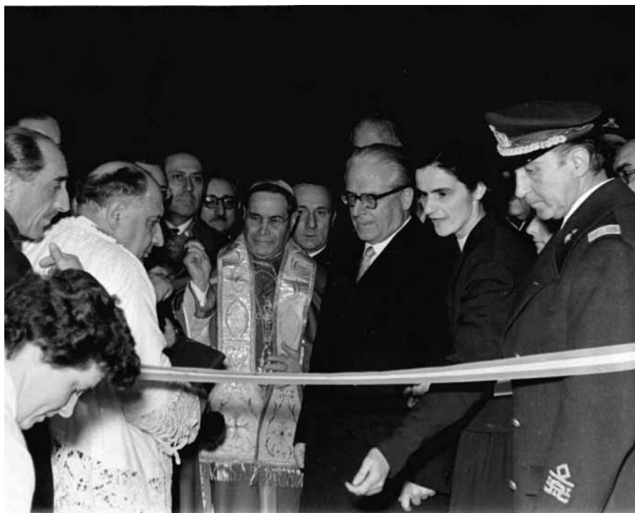
Zaira Spreafico con il Presidente della Repubblica Giovanni Gronchi all'inaugurazione della Nostra Famiglia di Ostuni il 9 marzo 1958.

Era il 9 marzo 1958 quando il Presidente della Repubblica inaugurò la prima Sede de La Nostra Famiglia fuori dalla Lombardia.