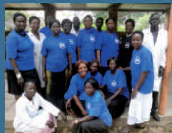
A Juba non smettiamo di sperare