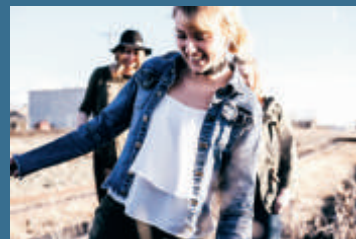
L'immaginazione emotiva degli adolescenti