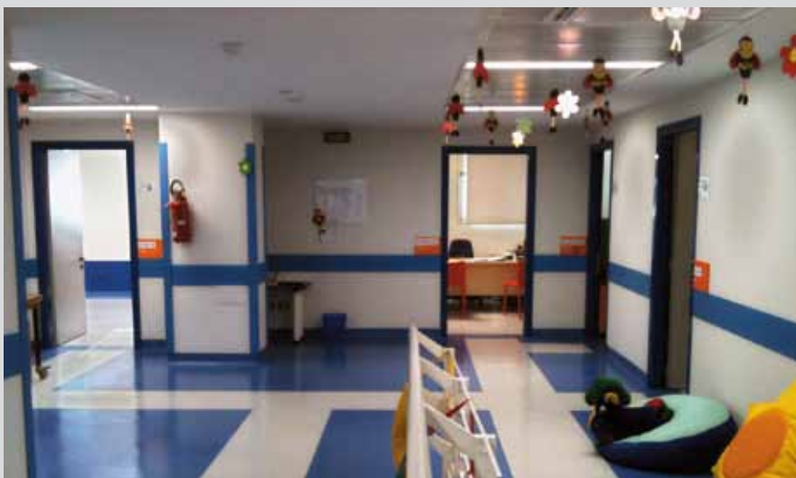
Bosisio Parini (Lc): il Centro Regionale per l'Ipovisione in Età Evolutiva dell'Istituto Scientifico Medea.

In Italia il primo centro per la cura, la riabilitazione e l'educazione specificamente dedicato a soggetti ipovedenti in età evolutiva fu proprio quello istituito nel 1972 presso il 5° padiglio-