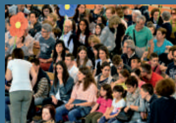
Pellegrinaggio a Lourdes