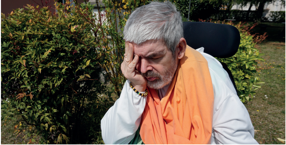
immagine e somiglianza: ha in sé un'impronta divina, significata dal soffio che lo anima.

Questa visione ci consente di dire che la disabilità o le differenze tra gli uomini non intaccano la realtà ontologica dell'uomo, il suo essere persona, la sua spiritualità, cioè la sua relazione con Dio, che prescinde quindi dalle caratteristiche individuali di ciascuno, dalla sua capacità cognitiva e dalla sua consapevolezza.